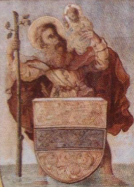
Wappen der Stadt Werne

Der Gnadenmutter von Werl in Dankbarkeit gewidmet. Die Fußwallfahrer aus Werne und Umgebung